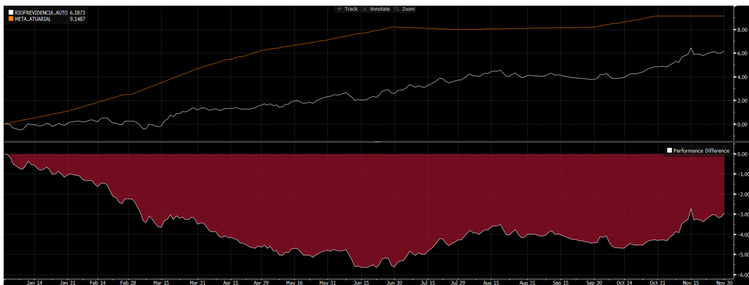
Figura 1. Rentabilidade Acumulada no Ano Atual e Comparação com a Meta Atuarial.

Governo do Estado do Rio de Janeiro Secretaria de Estado de Fazenda Fundo Único de Previdência Social do Estado do Rio de Janeiro